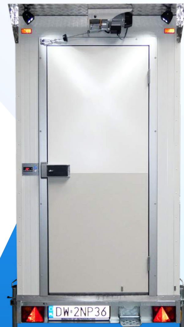
Drzwi do komory