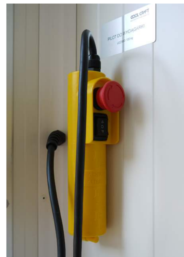
Pilot do sterowania