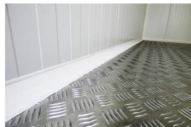
Podłoga z blachy ryflowanej